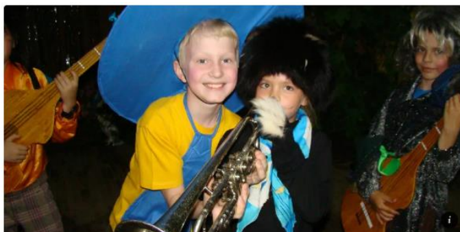
СПЕКТАКЛИ Театрализованное представление «День детства»

Театрализованные представления , погружающие посетителя в действие, направленное на трансляцию народных традиций, быта и нематериального культурного наследия (например, театрализованная программа «Культурный маршрут»)